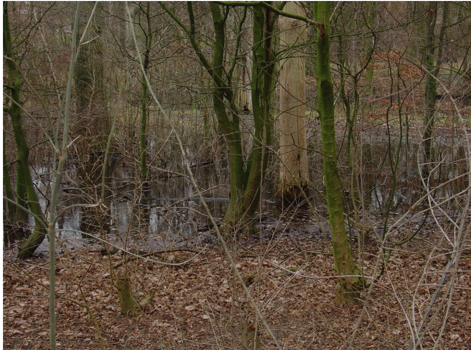
Impressie van het Heempark