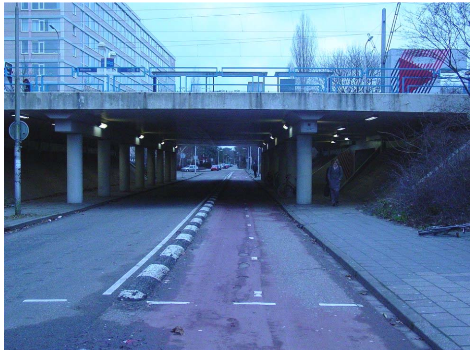
Onderdoorgang bij halte Uilenstede