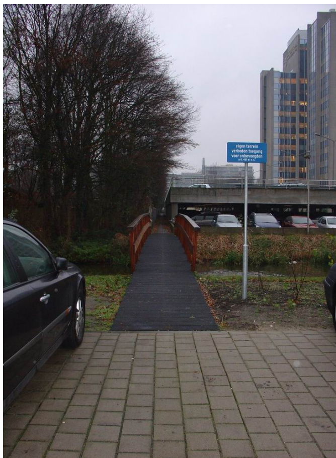
Route langs parkeergarage van Kronestede