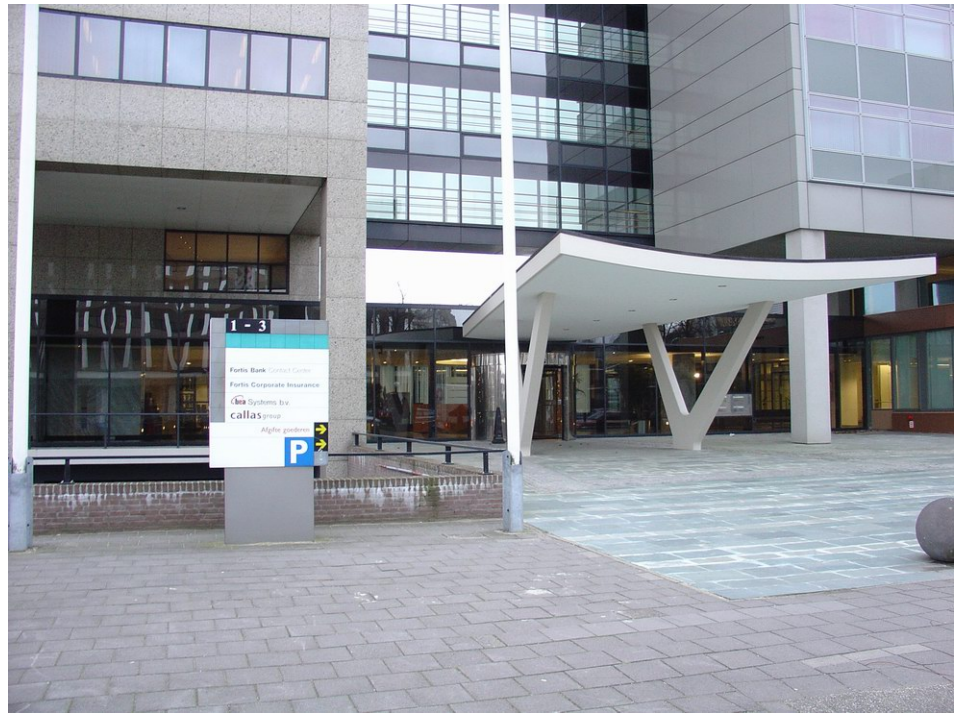
Entree van Prof. Bavincklaan 1-3