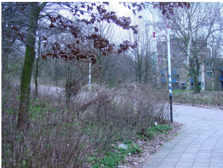
Overzichtelijke beplanting is aandachtspunt op de kruising richting Kalfjeslaan