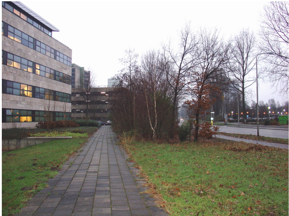
Dichte beplanting tussen hoofdrijbaan en voetpad van Laan van Kronenburg

De fietsroute in het verlengde van de Laan van Kronenburg (noordwaarts) loopt recht. Het niveauverschil hindert de overzichtelijkheid enigszins, maar voor de snelheid van fietser of voetganger is dat geen probleem. De verlichting is redelijk. Het grootste probleem op deze route is het gebrek aan sociale controle. Tijdens dit onderzoek is niet aan het licht gekomen dat deze route als zeer onveilig wordt ervaren.