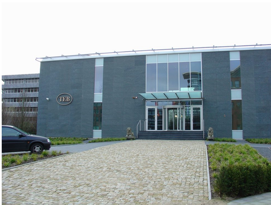
Hoofdentree van TEB