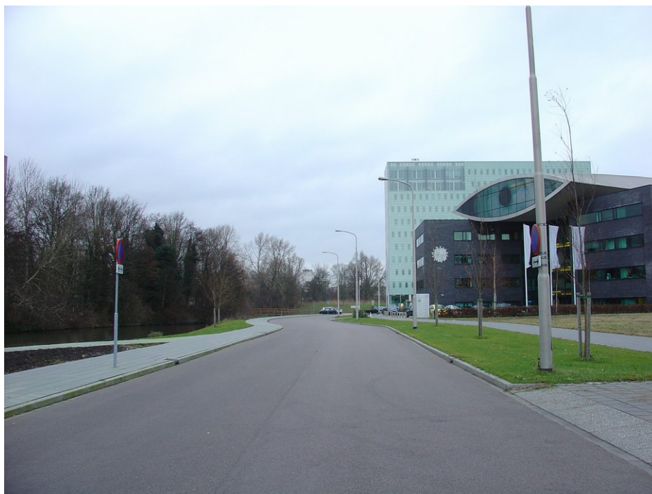
Prof. Keesomlaan met op de voorgrond lichtmast en boom zeer dicht bij elkaar