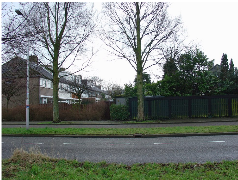
Verlichting Saskia van Uylenburgweg is gericht op hoofdrijbaan

Bij de Joodse begraafplaats is een parkeerterrein waar werknemers kunnen parkeren, die geen eigen plaats bij hun bedrijfspand hebben. Een aantal bedrijven uit de Prof. Keesomlaan financiert samen de toezichthouder en het pendelbusje. De toezichthouder is tussen 9 en 18 uur aanwezig. Dit betekent, dat er aan het begin en het eind van de dag auto's geparkeerd staan zonder toezicht. Het busje rijdt tussen 7 en 9.30 uur en tussen 16.30 en 19 uur en stopt bij de kantoorgebouwen.