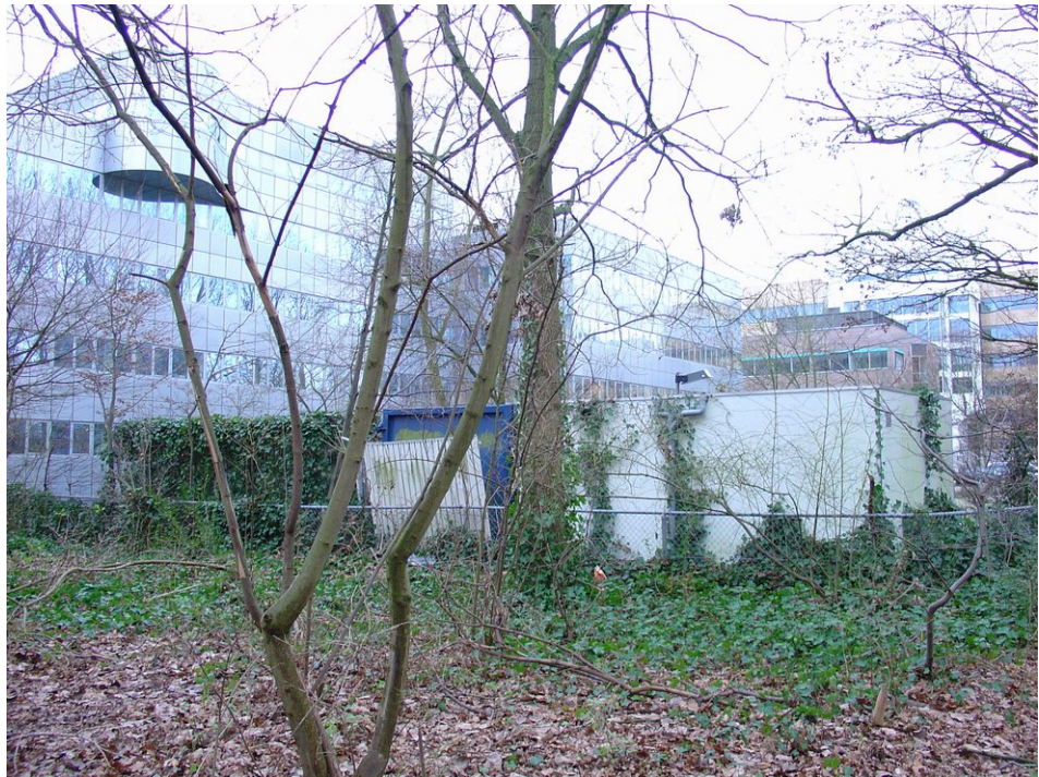
Royal Wessanen gezien vanuit het Heempark