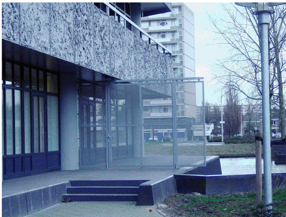
Beperkte toegang langs water