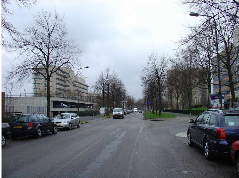
Overzicht van de Prof. Bavincklaan