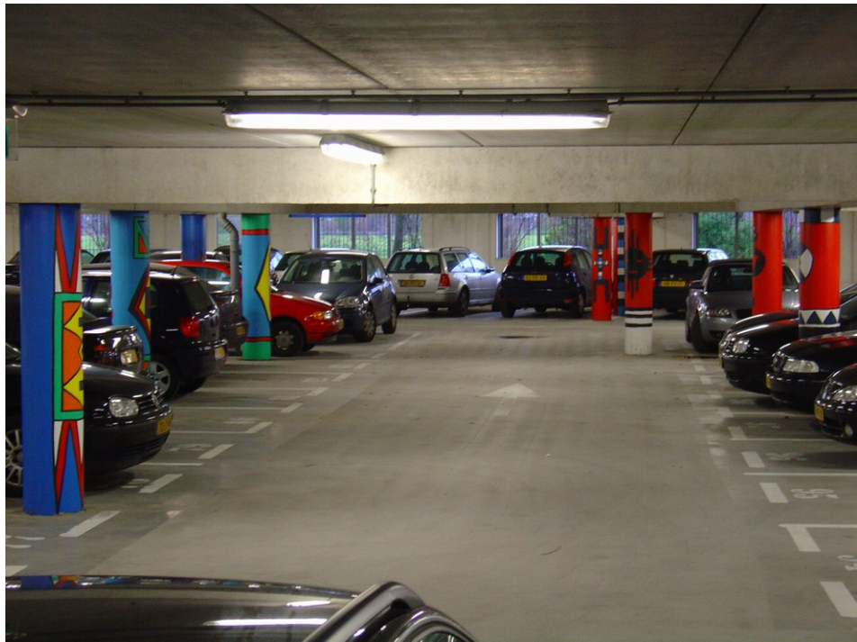
Parkeergarage van DDB groep