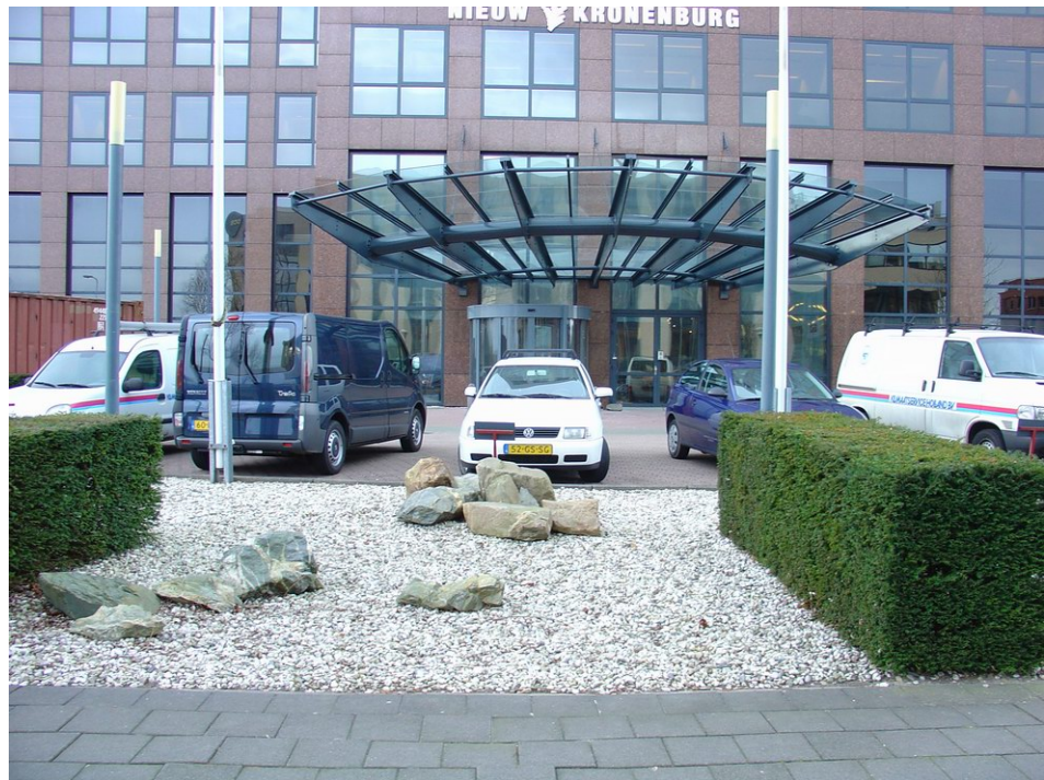
Hoofdentree Nieuw Kronenburg