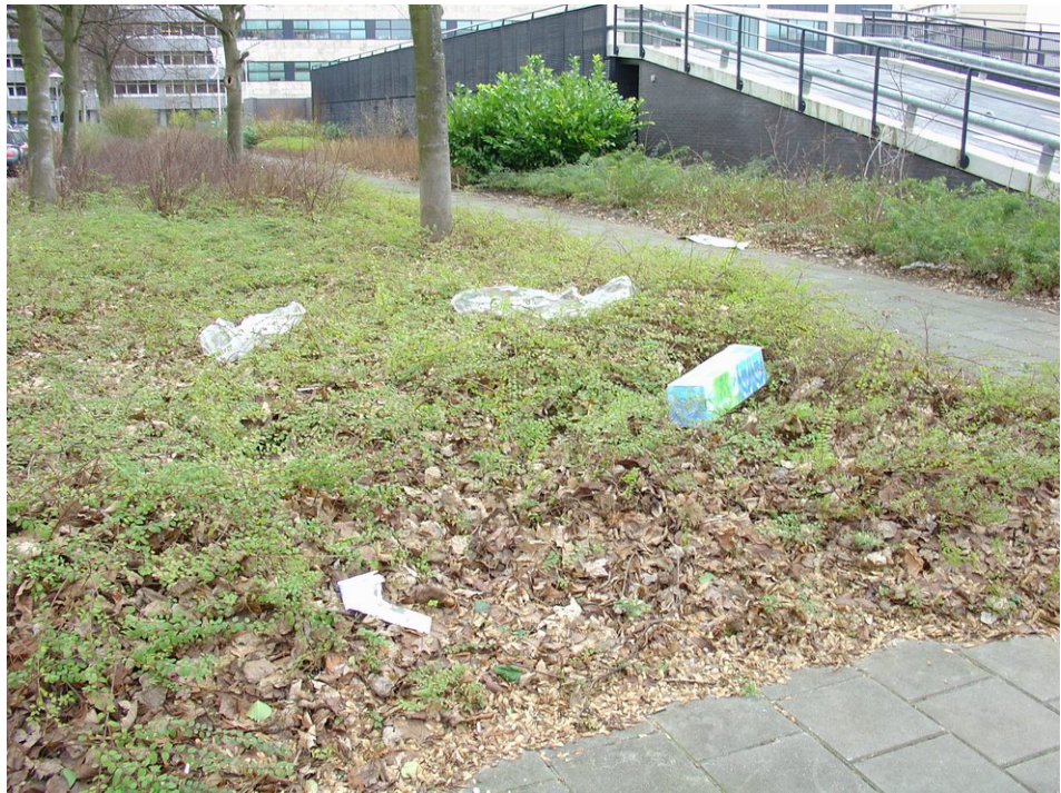
Zwerfvuil in de Prof. Meijerslaan