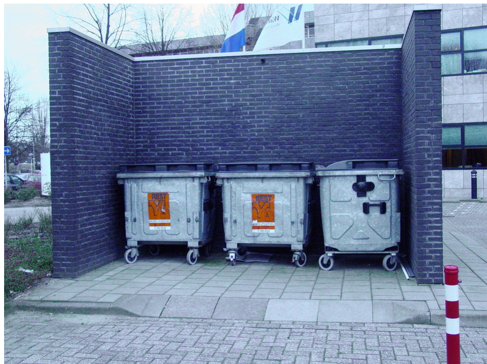
Containers op een eigen plek