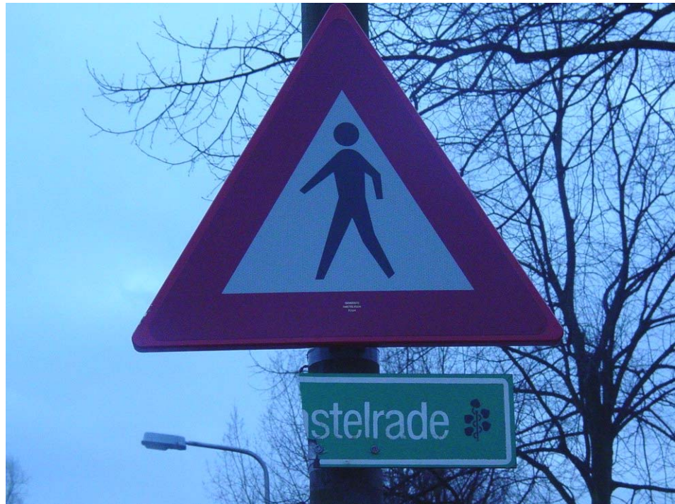
Bebording van Amstelrade