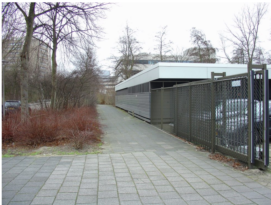
Hoge beplanting tussen het voetpad en de hoofdrijbaan van de Prof. Meijerslaan

Ons inziens zijn de leegstaande en verpauperde panden (voormalig GAK en Belastingdienst) aan Uilenstede en Prof. Meijerslaan ook een belangrijke factor ten aanzien van gevoelens van onveiligheid. Tijdens de workshop gaven vertegenwoordigers van twee bedrijven en van Intermezzo aan dat de verpauperde panden één van de belangrijkste problemen zijn in het gebied. (zie verder §3.2 en 3.3).