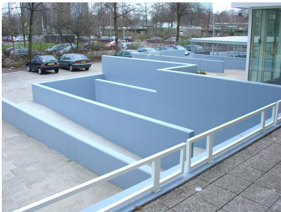
Hellingbanen bij entree van Amstelrade