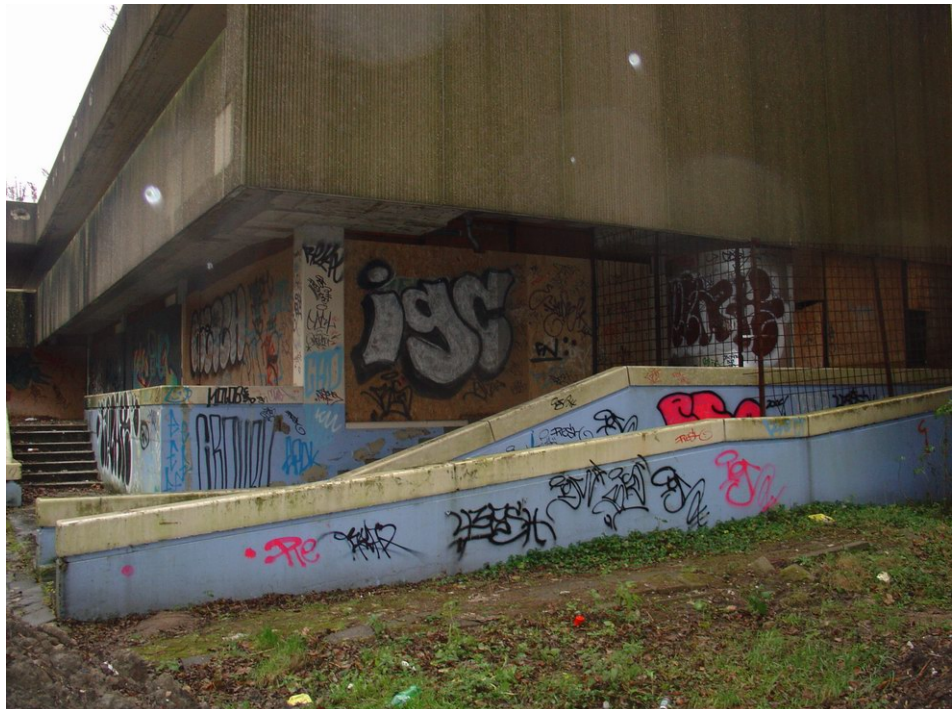
Het leegstaande GAK-pand