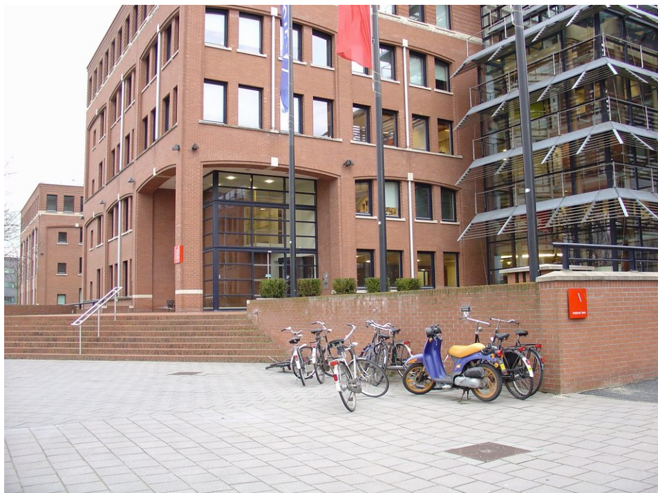
Fietsparkeren bij entree