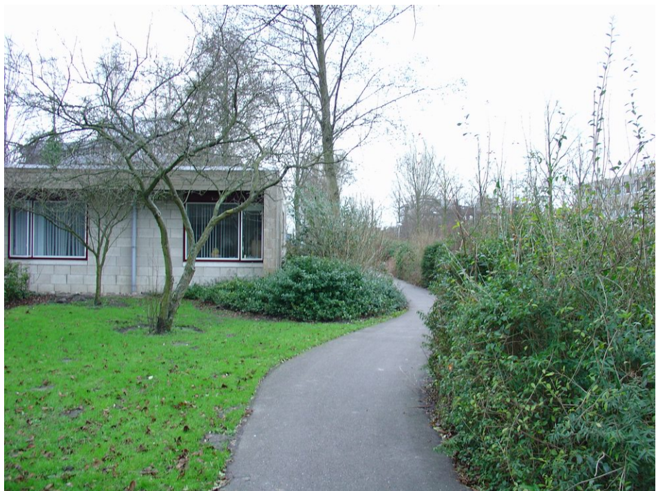
Pad van Amstelrade parallel aan de openbare ruimte