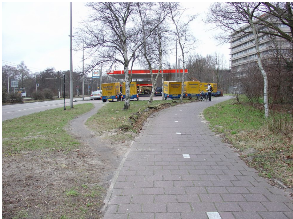
Onoverzichtelijke route achter pompstation langs

Halte Kronenburg is overzichtelijk en goed zichtbaar vanuit de omgeving. Halte Uilenstede wordt hierboven beschreven onder 'Uilenstede'.