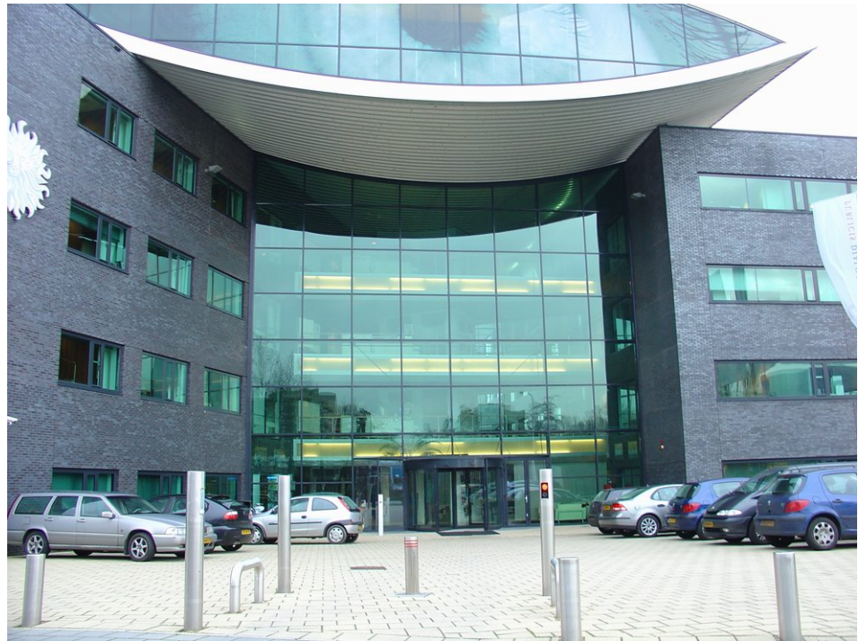
Hoofdentree van Prof. Keesomlaan 12