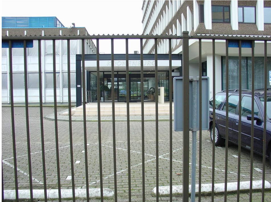
Hoog hekwerk tussen trottoir en entree