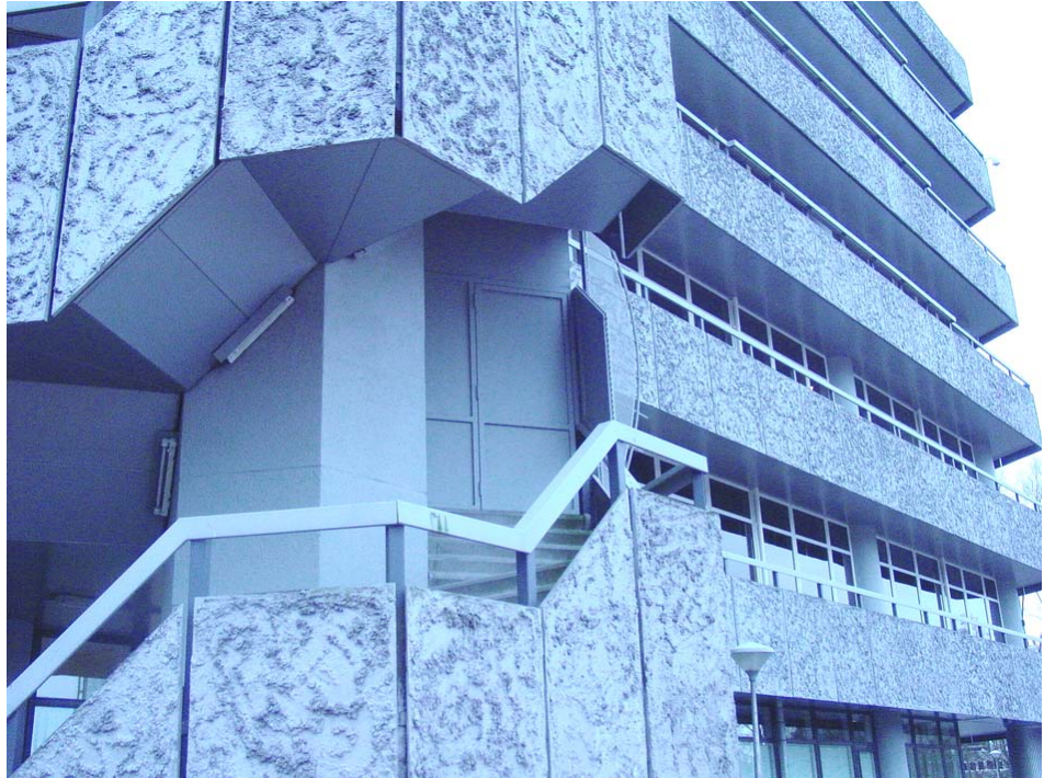
Noodtrap niet toegankelijk vanaf maaiveldniveau