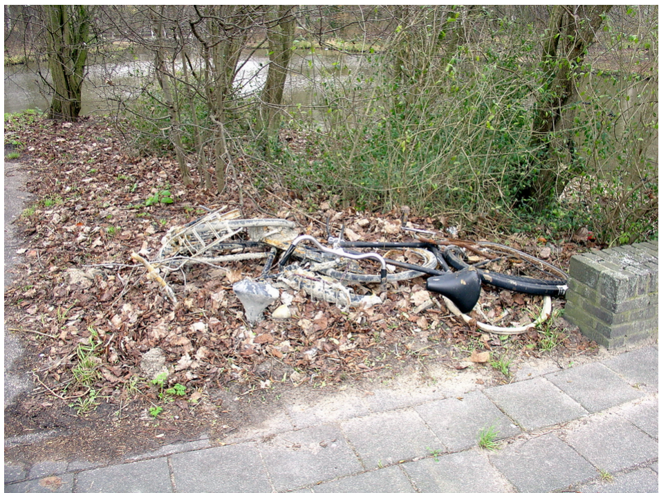
Zwerfvuil aan de rand van het park in de Prof. Meijerslaan

Op twee plaatsen is tijdens de schouw hoge en ontransparante beplanting opgevallen: langs het fietspad van de Beneluxbaan, waar fietsers achter het benzinstation doorrijden en langs de Prof. Meijerslaan.