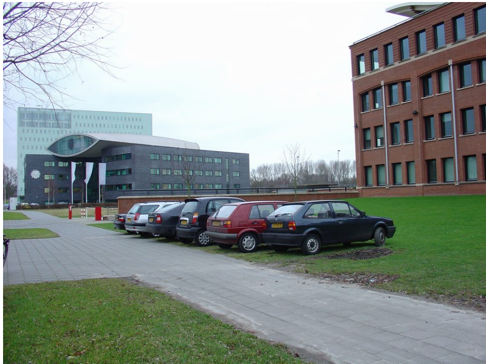
Parkeerplaatsen in het gras