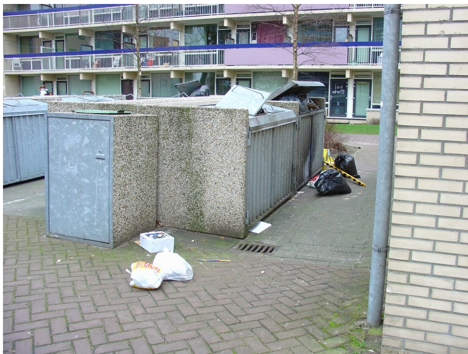
Overvolle afvalbakken in Uilenstede

Achter het woongebied langs, aan de kant van het bedrijventerrein, loopt een hondenuitlaatpad. De route is recht en de beplanting was tijdens de schouw voldoende overzichtelijk.