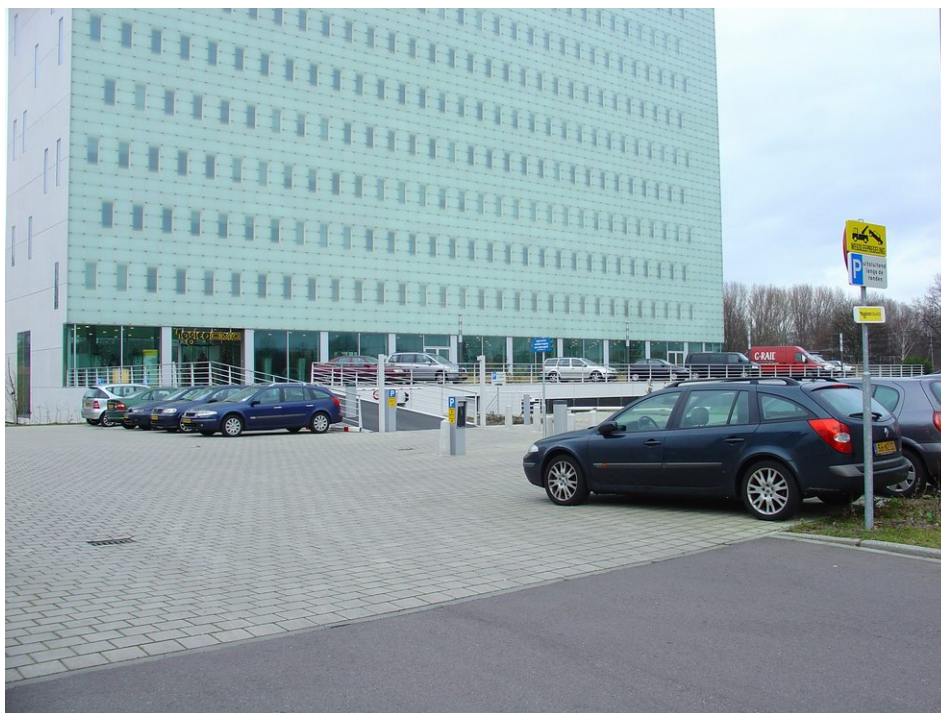
Voorterrein van Prof. Keesomlaan 14