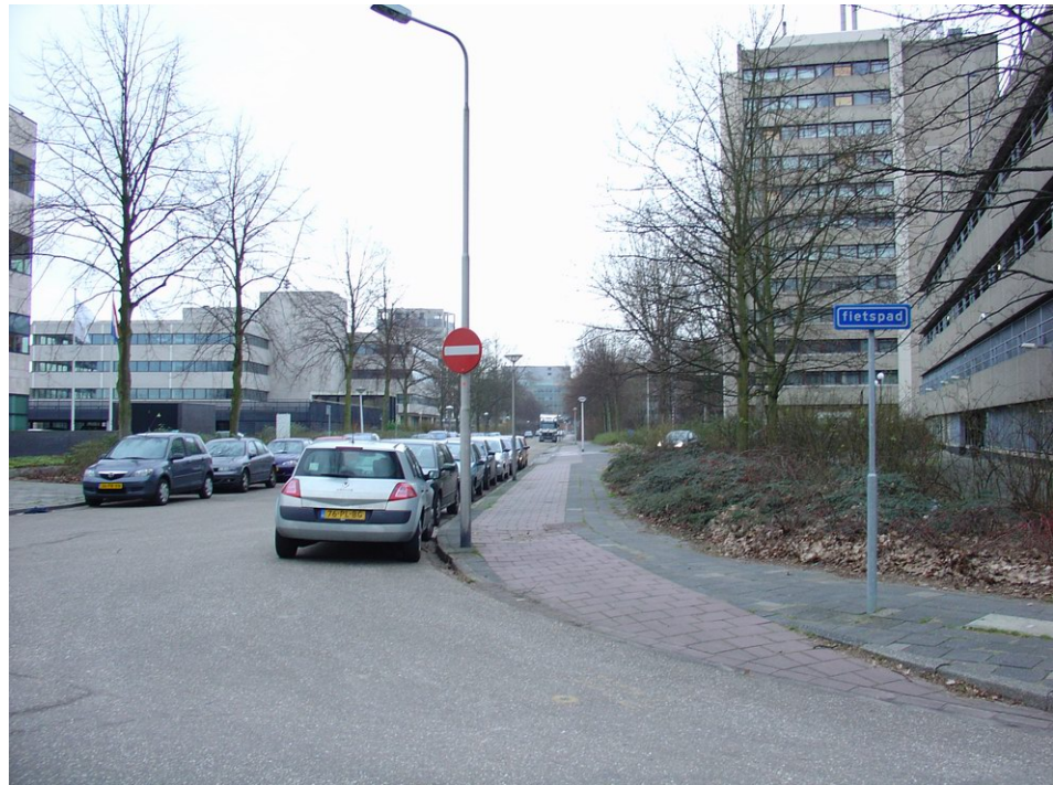
Bebording op Prof. Meijerslaan waaruit tweezijdigheid fietspad niet blijkt