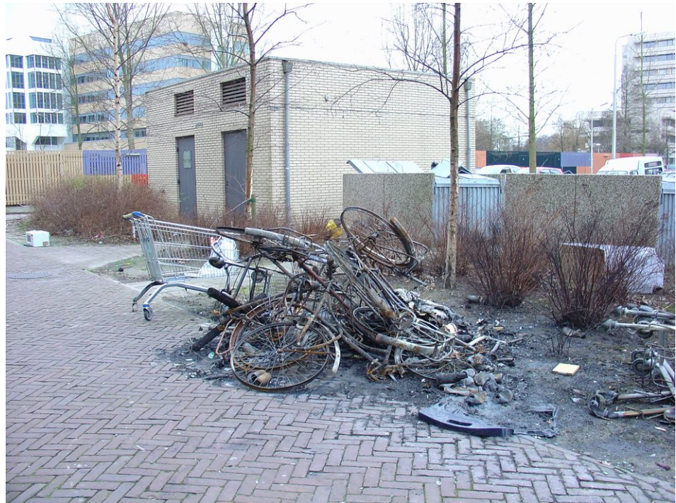
Fietswrakken in Uilenstede