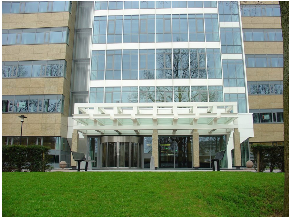
Entree van Bavinckhouse