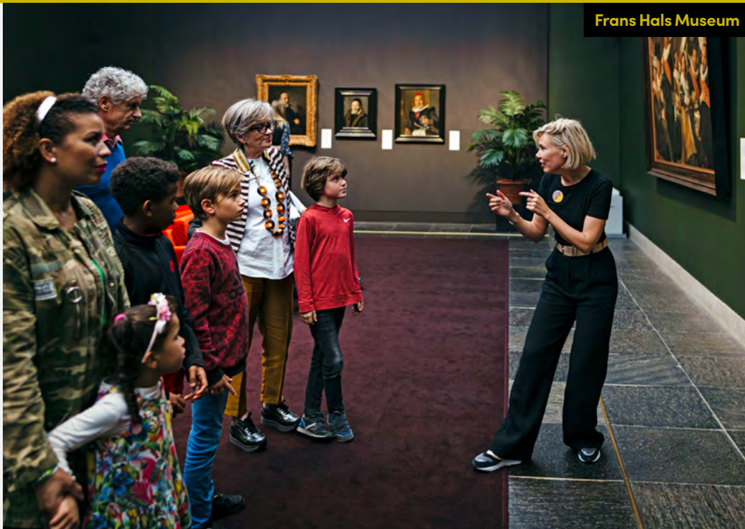
Frans Hals Museum