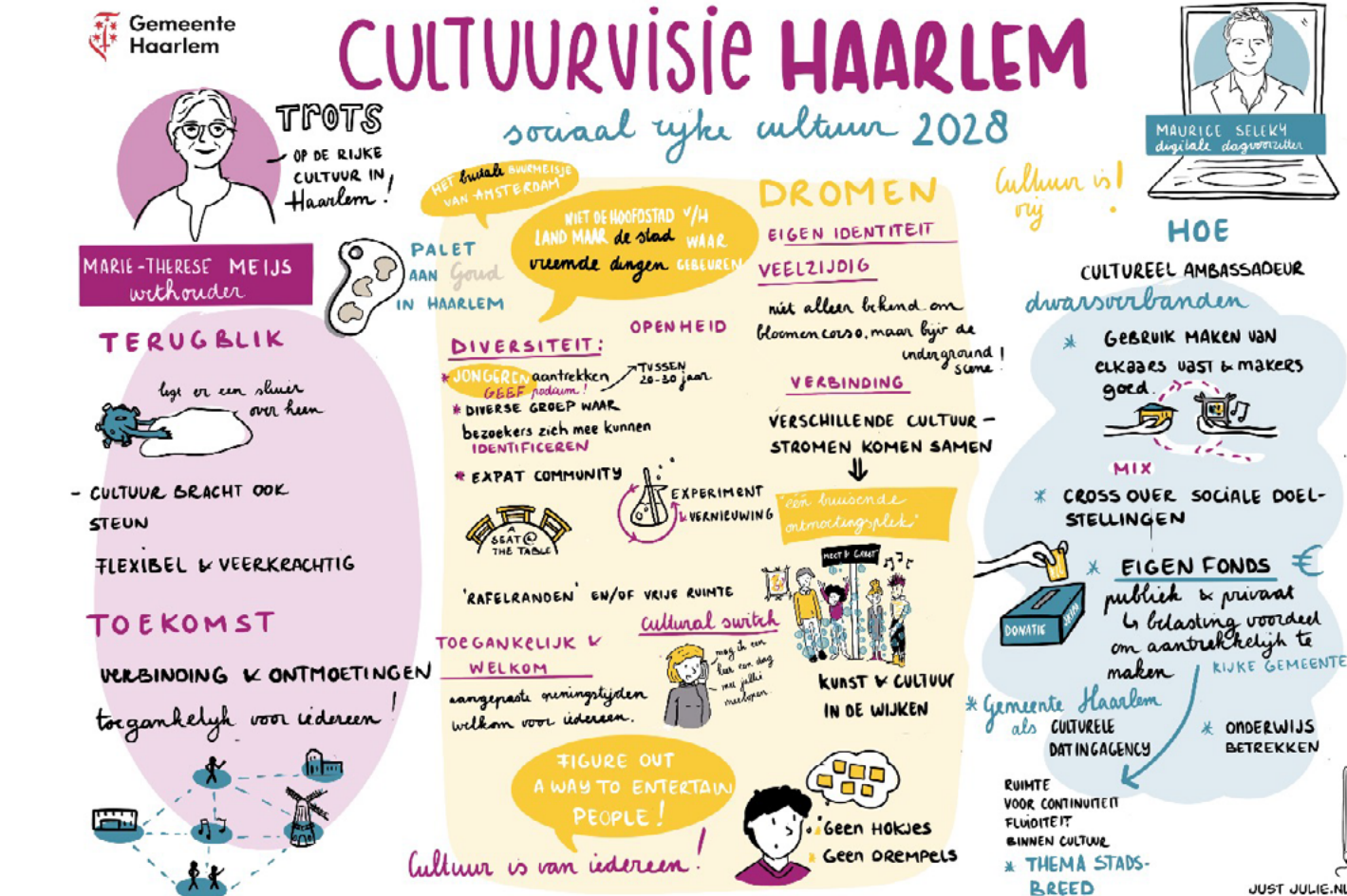
Figuur 1. Getekend verslag van het stadsgesprek (16-12-2020).

inspirerende cultuureducatie-projecten. Tegelijkertijd constateerden veel partijen dat men geen weet heeft van elkaars activiteiten. Het verbinden van al die initiatieven, instellingen en cultuurmakers vormt de grote uitdaging voor de komende jaren, oftewel een eenheid vormen van de archipel aan losse eilandjes, die Haarlem nu nog teveel is. Zodat we de