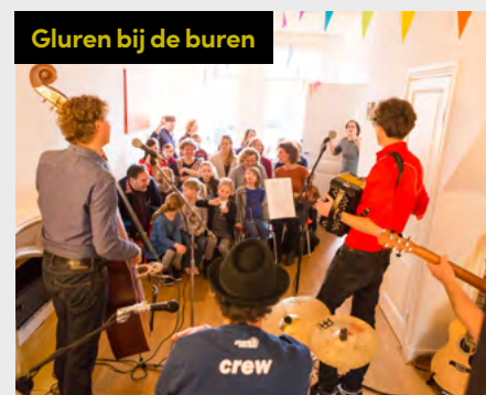
Gluren bij de burens

Het nieuwe Cultuurplan start per 1 januari 2022. We zullen niet alle ambities direct kunnen realiseren. Het betreft een gezamenlijke impuls op het versterken van cultuur in Haarlem, die in onderlinge afstemming ontwikkeld moet worden. Dat vraagt tijd en ruimte. Als in een groeimodel brengen we kansen en mogelijkheden in kaart, versterken we ons netwerk, bouwen we voort op wat we al doen, ontwikkelen we nieuwe plannen, en gaan we aan de slag. De beschikbare capaciteit bij culturele makers en instellingen én de gemeente kent ook grenzen. Het Cultuurplan is ambitieus, de gemeente heeft hier slechts 5 fte voor beschikbaar. Jaarlijks stellen we prioriteiten en sturen we bij waar nodig, ook wat betreft de ambtelijke inzet. Aan de hand van de volgende agenda werken gemeente en culturele makers en instellingen gezamenlijk aan het realiseren van de visie en ambities voor onze prachtige cultuurstad.