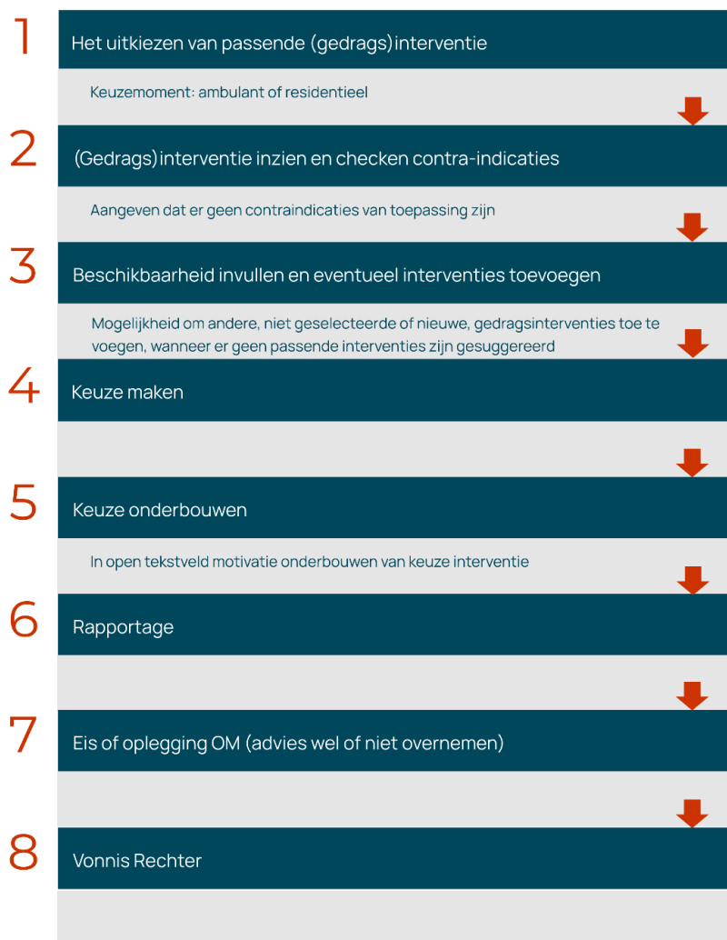
Figuur 1.3 Stappen in het proces van LIJ suggestie voor tot opleggen van een gedragsinterventie

In de handleiding van het LIJ is aangegeven dat na het invullen van de Ritax B het ARR, het DRP en de risicoscores op de domeinen bekend zijn. Dan is de vraag aan de orde of de jongere in aanmerking komt voor één of meerdere gedragsinterventies, vormen van (jeugd)reclasseringstoezicht en/of de gedragsbeïnvloedende maatregel. Zoals eerder gezegd maakt het LIJ een match tussen de jongere en de inclusiecriteria van de (gedrags)interventies. De raadsadviseur checkt vervolgens op eventuele contra-indicaties. Hieronder worden de stappen van de systematiek toegelicht zoals die beschreven zijn in de handleiding van het LIJ. In figuur 1.3 hieronder geven we een schematische weergave van de stappen.