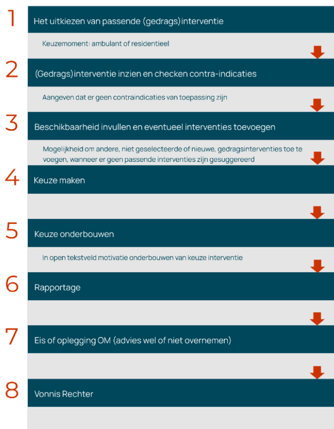
Figuur 1 Stappen in het proces van LIJ tot aan het opleggen van een gedragsinterventie

Het onderzoek laat zien dat de interventie-suggesties van het LIJ in de praktijk slechts beperkt worden overgenomen. Hier zijn in de regel goede gronden voor. Een nadere beschouwing van de wijze waarop met het LIJ wordt gewerkt maakt dat duidelijk.