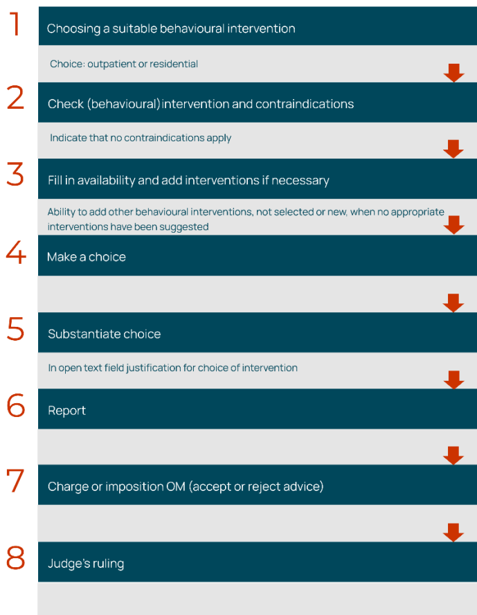
Figure 1 Steps in the process from LIJ to the imposition of a behavioural intervention

The study shows that the LIJ's intervention suggestions are adopted only to a limited extent in practice. There are generally good reasons for this. A closer look at how the LIJ is used makes this clear.